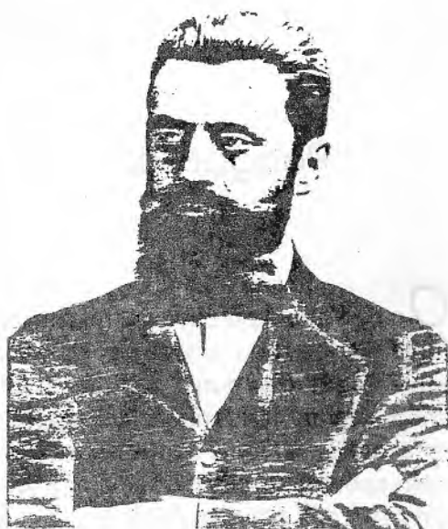
Theodore Hertzl, penemu zionisme

Swiss. Konperensi ini dihadiri 300 orang anggota, terdiri atas dokter, ahli hukum, ahli keuangan, dan perdagangan, serta para kohanim yang mewakili 50 Asosiasi Yahudi, baik yang rahasia maupun yang terbuka.