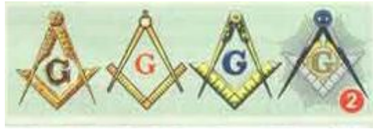
Gambar 10: Jangka Pengukur

Pada tahun 1999 ini, mereka sendiri yang akan menyulut kekacauan agar memudahkan jalan bagi mereka mengisi perbaikan dunia menuju "reformasi milenium baru". Simbol-simbol setan tersebut antara lain berbentuk sebagai berikut: