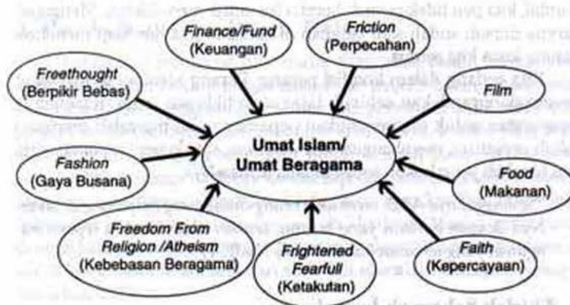
Gambar 14: Jaringan Dajal sebuah Gerakan Kafirisasi Global