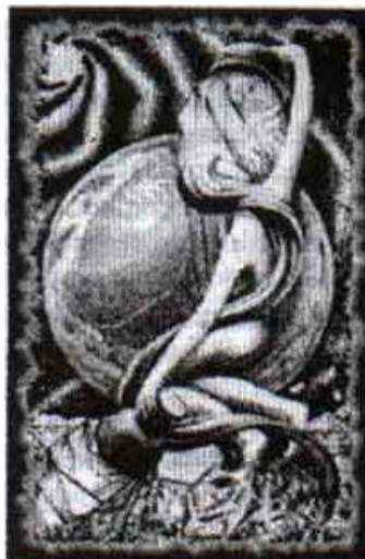
Gambar 1: love is the law, love under will

Kemerdekaan manusia tidak pernah akan tercapai selama di belenggu oleh dogma-dogma agama, sebagaimana kerinduan Nietzsche yang memimpikan Übermensch (manusia unggul) --sebab Iluminasi menekankan falsafah kegiatannya kepada kekuasaan. Manusia baru menjadi manusia apabila mereka bebas tanpa ikatan. Manusia baru berdiri di atas kepribadiannya sendiri yang kuat melalui falsafahnya pada "3L" yaitu: life, love, and liberty (hidup, cinta, dan kebebasan) sebagai motto kehidupan yang akan membebaskannya dari "racun" agama. Dalam setiap pembicaraan atau komunikasi, mereka selalu menuliskan, "Cinta adalah hukum dan cinta di bawah kendali keinginan (love is the law, love under will)."