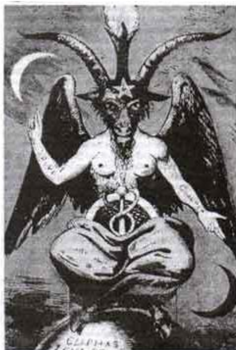
Gambar 5: Dewa Baphomet

Nama God (Tuhan) seringkali diasosiasikan dengan nama goat (kambing) yang sekaligus dijadikan sebagai lambang penyembahan atau berhala. Atau merepresentasikan scape goatism (teori mencari kambing hitam), sesuai dengan teori konspirasi dalam gerakan rahasia mereka.