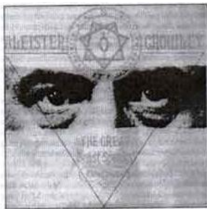
Gambar 8: Crowley

Mereka sangat membanggakan nilai kemanusiaan, persamaan hak, dan kebebasan (humanity, equality, dan freedom). Manusia dilahirkan sama dan harus mempunyai kebebasan yang sama. Seseorang melebihi yang lain, berarti melawan fitrah karena kelebihan seseorang dari yang lain, berarti telah merampas sebagian dari kebebasan manusia yang lain. La Vey menetapkan tiga ajaran pokok setanisme, yaitu memuaskan rasa ingin tahu intelektual, tindakan kebebasan individu, dan memanjakan diri (intellectual curiosity, personal liberty of action, dan physical indulgence).