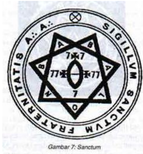
Gambar 7: Sanctum

sigillum sanctum fraternitum yang menghiasi cakra tujuh segi sebagai lambang kebebasan universal (universalist liberalist).