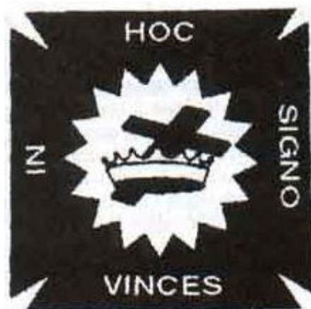
Gambar 4: Simbol The Knight Templar

(The Knight Templars were sworn to poverty, chastity, and obedience. They were obliged to cut their hair but forbidden to cut their beards, thus distinguishing themselves in an age when most men were clean shaven --Michael Baigent hlm. 63).