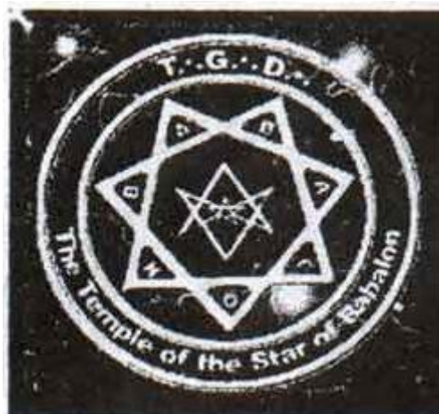
Gambar 6: Thelema

dunia. Oleh karena itu, segala macam dogma agama harus disingkirkan, sebab itu memenjarakan manusia: kebebasan, hawa nafsu, seks, dan segala keinginan manusia yang harus dinikmati, selama tidak mengganggu orang lain. Itulah sebabnya, ajaran setan ini mengakomodasi para lesbian, homoseksual, dan kebebasan seks.