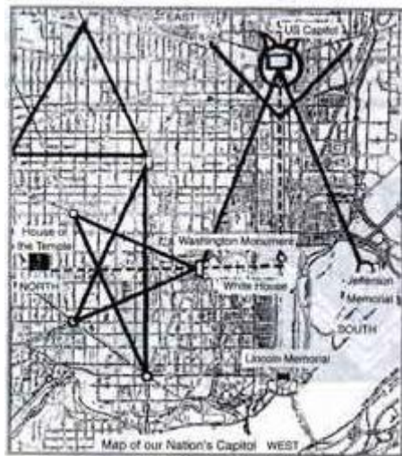
Gambar 9: Denah Monumen Washington

Di samping itu, mereka mempercayai angka-angka. Mereka menafsirkan angka-angka tersebut sebagai bagian dari rencana mereka, sehingga ramalan yang diperkirakannya dapat menjadi kenyataan. Misalnya, mereka meramalkan bahwa pada tanggal 31 Desember 1999 adalah akhir dari segala kejayaan agama-agama di muka bumi, serta bangkitnya Kerajaan Sion untuk memerintah millennium baru yang diawali tahun 2000.