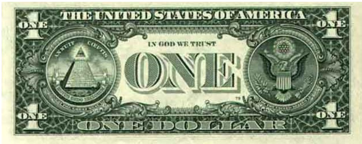
Gambar 3: Uang Satu Dolar A.S.

Seluruh lembaga keuangan internasional yang telah dirintis oleh Meyer Rothchild harus menunjukkan keperkasaannya dalam bidang finansial. Pemilikan saham perbankan, multinasional, dan teknologi termasuk microchip harus dimiliki secara mayoritas oleh persaudaraan anggota freemason.