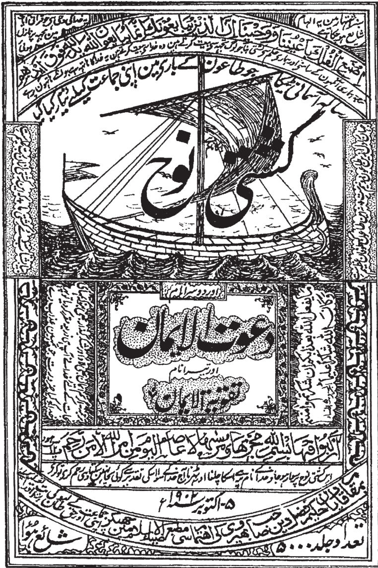
Facsimile of the original Urdu title page printed in 1902