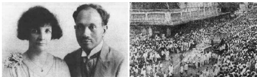
Foto 2: Dokter Soetomo dengan Istri (Kiri) dan Prosesi Pemakaman Dr. Soetomo (Kanan)

Sumber: Dokter Soetomo . Diakses dari http://www.imexbo.nl/dokter-soetomo.html . Tanggal 23 Maret 2017. Pukul 21.17 WIB.