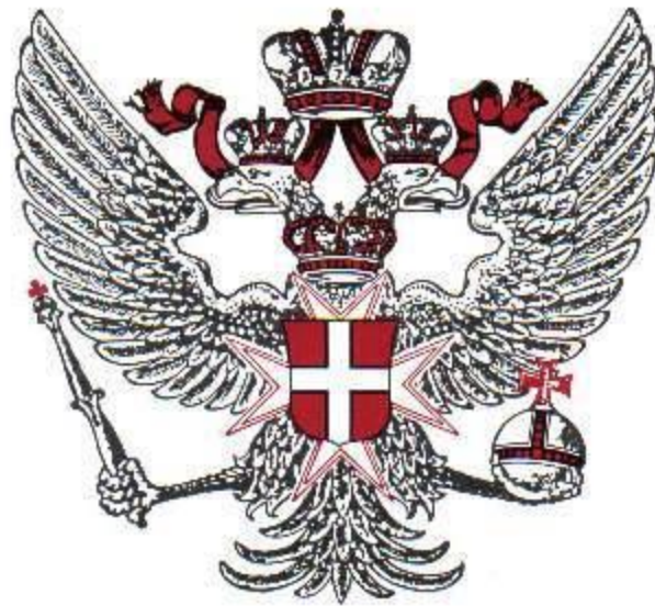
Knight of Malta

The Knights Hospitaller yang nama lengkapnya dalam bahasa Inggris adalah : The Order of Knights of the Hospital of St. John of Jerusalem sering juga disebut dengan Knights of Malta atau Knights of Rhodes . Dua nama terakhir lebih merupakan nama sebutan berdasarkan base Ordo itu yang berpindah beberapa kali.