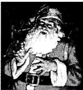
sinterklas, pengaruh mitologi Barat terhadap Kristen

sebagai uskup yang ramah, suka menolong anak dan orang miskin. Namun, legenda Santo Nicholas juga bercampur dengan legenda lain tentang 'pemberi hadiah' dari kalangan kaum pagan yang memiliki kekuatan sihir yang menghukum anak-anak nakal dan memberi hadiah kepada anak-anak yang baik. Dia biasa menaiki kereta terbang yang ditarik rusa kutub. Namun, ada juga legenda tentang Sinterklaas yang menggambarkan orang tua berjanggut putih panjang berpakaian uskup menaiki kuda yang bisa terbang ke atap rumah, dibantu budaknya Swarte Piet . Sinterklaas datang tanggal 25 Desember malam, ke rumah-rumah untuk memberi hadiah bagi anak-anak yang baik melalui cerobong asap. Gambaran Sinterklaas , yang berkulit putih dan pemurah kepada anak-anak, bisa dijadikan sebagai bahan propaganda tentang kebaikan orang kulit putih. Sebaliknya, budak hitam Swarte Piet , pembantunya, budak berkulit hitam, digambarkan bersifat kejam, dan suka mencambuk anak-anak nakal. Karena sejarah kehidupan Nicholas tidak jelas, Paus Paulus VI menanggalkan perayaan Santo Nicholas dari kalender resmi gereja Roma Katolik pada tahun 1969. Ada juga Santa Claus versi Amerika, yang berasal dari Kutub Utara. Santa Claus di AS adalah ciptaan dari Public Relations Manager untuk mempromosikan produk minuman tertentu. Karena orang Amerika tidak mau disebut rasis, maka Santa Claus di AS tidak ditemani oleh pembantunya yang berkulit hitam.