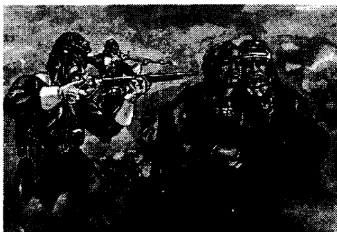
Penghancuran alam dan orang Indian akibat kedatangan Eropa ke Amerika

Bagi Mohawk, jalan hidup yang dipilih dan dikampanyekan peradaban Barat, sebenarnya adalah jalan kematian bagi umat manusia. Belum pernah ada peradaban yang memproduksi senjata pemusnah massal seperti di era sekarang ini. Ilmu pengetahuan dikembangkan