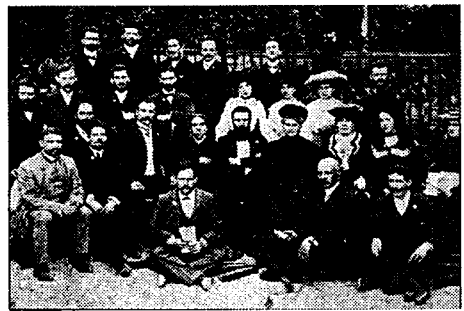
Theodore Herzl dan kawan-kawan dalam kongres Zionis

Herzl bisa dikatakan seorang penulis skenario, sutradara, sekaligus aktor penting dalam gerakan Zionis. Rencananya untuk menyelenggarakan Kongres Zionis Pertama di Munich berhasil digagalkan oleh Yahudi Jerman, tetapi ia tidak putus asa, dan memindahkan Kongres ke Basel, Swiss. Sesaat sebelum Kongres itu dimulai, para rabbi Yahudi Ortodoks di Jerman mengeluarkan