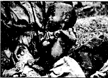
Dua foto yang mengkontraskan kehidupan mewah Barat dan kelaparan dan kemiskinan di negara-negara non-Barat

Ketidakdilan global terhadap dunia ketiga dapat dilihat dalam kasus utang luar negeri yang kini banyak menjerat negara-negara miskin. Jeratan utang luar negeri, dalam banyak sisi, bisa dikatakan sebuah penindasan dan ketidakdilan.