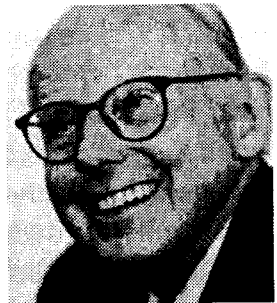
Samuel P. Huntington

Siapa Huntington? Ilmuwan politik dari Harvard University ini menulis dalam pengantar bukunya The Clash of Civilizations ., "Buku ini tidak dimaksudkan sebagai karya ilmiah sosial. Ia dimaksudkan sebagai penafsiran atas evolusi politik global sesudah Perang Dingin. Ia dipersembahkan untuk memberikan bingkai kerja, paradigma dalam memandang politik global yang akan