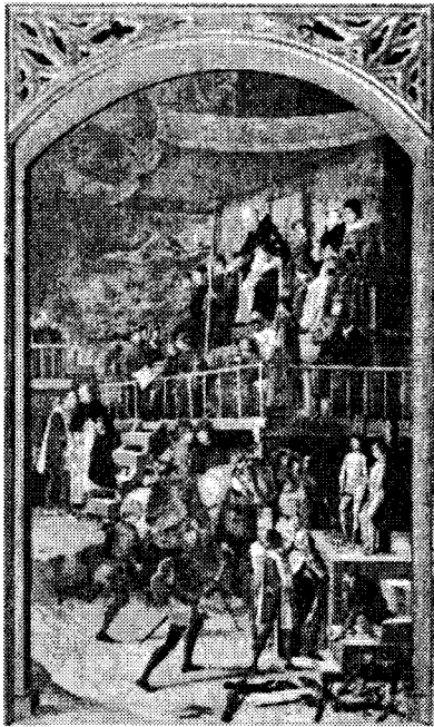
Contoh kekejaman Inquisisi