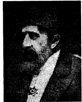
Sultan Abdul Hamid II

Yang ironis, di tengah kerasnya penolakan Abdul Hamid II terhadap Zionisme, imigran Yahudi yang datang ke Palestina justru bertambah secara mencolok. Pada periode 1882-1904, yang dikenal sebagai First Aliyah (the First Immigration) , sekitar 30.000 imigran Yahudi dari Eropa Timur datang ke Palestina dengan dukungan dana dari keluarga Rothschild yang superkaya. Aliyah kedua, yang terjadi tahun 1904 sampai mulainya Perang Dunia I, ditandai dengan imigrasi sekitar 33.000 orang Yahudi. Imigrasi besar-besaran Yahudi di Jerusalem dan wilayah Palestina lainnya ini menunjukkan adanya ketidakefektifan dari kebijakan pemerintahan Utsmani. Hasilnya, populasi Yahudi di Palestina meningkat secara dramatis pada akhir abad ke-19 dan awal abad ke-20; dari 24.000 pada tahun 1882