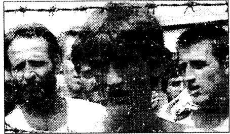
Pembantaian Muslimin Bosnia dan diamnya para pemimpin Eropa

Bosnia tidak sah, dan negara-negara OKI akan mengirimkan senjata kepada Muslimin Bosnia agar dapat membela diri. Konferensi GNB di Jakarta 1992, telah menyerukan hal yang serupa, yaitu pencabutan embargo senjata di Bosnia. Dasar pemikirannya sederhana: jika PBB dan negara-negara Barat enggan memberikan perlindungan terhadap penduduk Muslim Bosnia, biarkan mereka mendapatkan senjata untuk melawan Serbia yang memiliki persenjataan yang jauh lebih unggul.