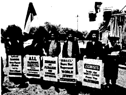
Gerakan Naturei Karta

Tampak bahwa istilah 'Zionisme', digunakan dalam kerangka kepercayaan dan harapan ini. Orang-orang Yahudi yang sedang diusir dan dianiaya di Eropa, kemudian, diidentikkan dengan kondisi Yahudi yang berada dalam pengusiran di Babylon, setelah Kota mereka dihancurkan oleh Nebuchadnezzar pada 586 SM. 2