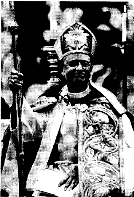
Gene Robinson, Uskup New Hampshire yang homoseks