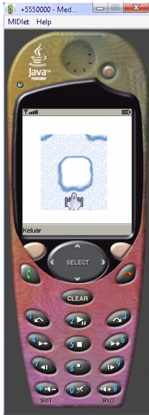
Gambar 2: Sprite di LayerManager