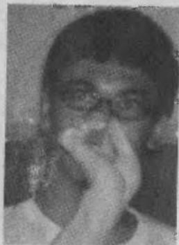
model by kambing ganteng.

VIOLA! Anda baru saja melakukan gaya swahili!!!! Pasangan anda pasti senang sekali, jika anda swahili dengan sempurna, kalian berdua bisa merasakan getaran" cinta yang merembet didalam sekujur tubuh anda. Ruarr biasaaa!